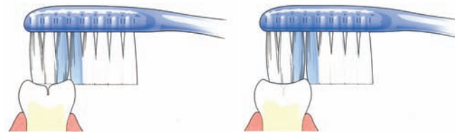
Tandenborstel komt niet in de groef

Bij zowel melkkiezen als blijvende kiezen zitten veel groefjes op het kauwvlak. Daarin ontstaat gemakkelijk tandplak. Niet regelmatig verwijderde plak kan gaatjes veroorzaken. Goed poetsen dus. Om het kauwvlak goed te beschermen, kan de tandarts een laagje 'kunsthars' (sealant) aanbrengen. Dit heet 'sealen'. Diepe groeven kan uw tandarts door het sealen afdichten. Alleen de blijvende kiezen komen normaal gesproken in aanmerking om te sealen. Dit gebeurt meestal kort nadat de blijvende kiezen helemaal zijn doorgebroken. De tandarts zal alleen sealen als hij verwacht dat er gaatjes in de groefjes ontstaan. Ook gesealde kiezen moeten goed worden gepoetst.